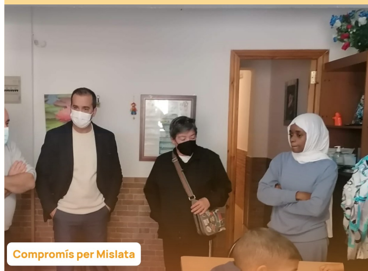
Compromís per Mislata

También pide que se tomen sanciones económicas y políticas contra los ocupantes ilegales del territorio de la antigua colonia española del Sáhara occidental, hasta que se cumplan las resoluciones internacionales y el plan aprobado por el Consejo de Seguridad de la ONU en 1990 que proponía un referéndum de autodeterminación del pueblo saharauí.